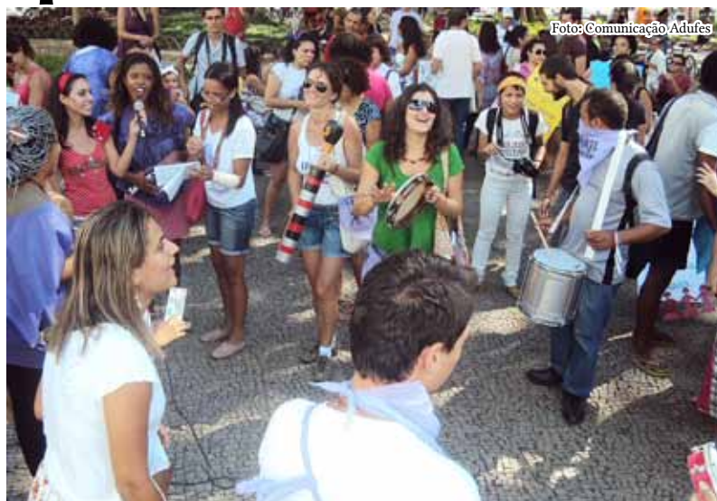
Ato Público reuniu mulheres do campo e da cidade na Praça Costa Pereira, em Vitória.